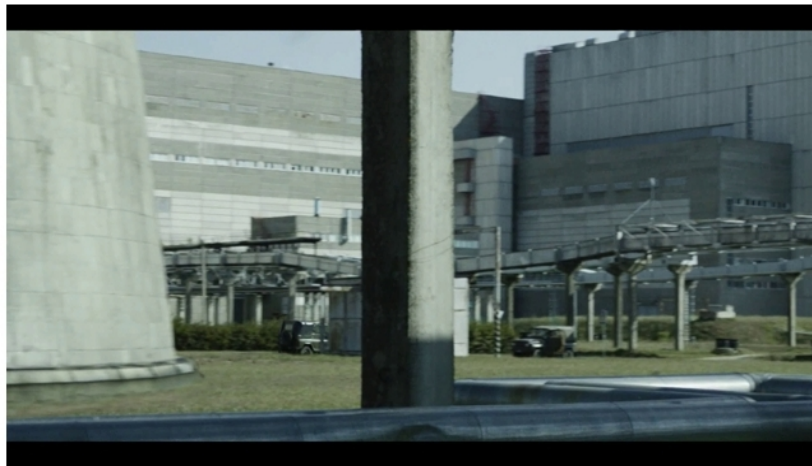
Les abords d'un réacteur de la centrale-décor dans CHERNOBYL