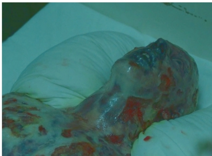
L'acteur grimé dans le rôle d'Ignatenko

« Tout ce qui est excessif est insignifiant », propos prêté à Charles-Maurice de Talleyrand-Périgord. Visiblement Craig Mazin prend ici sa place en bonne position dans la longue lignée des auteurs et cinéastes ayant brodé sur Tchernobyl, dont il s'inspire visiblement assez souvent. Illustrons la méthode avec ce qui a sans doute le plus frappé d'horreur et de compassion les spectateurs, le jeune pompier Ignatenko dans sa bulle stérile – à gauche un plan du film, E3 (35:41) ; à droite une photo d'archive :