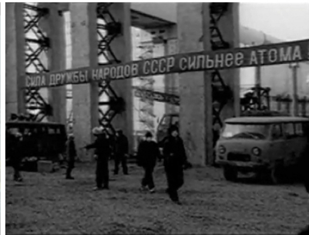
Les abords du Bloc 4 de Tchernobyl en août 1986

Texte de la banderole : « La vigueur de l'amitié entre les Peuples de l'URSS est plus forte que l'Atome »