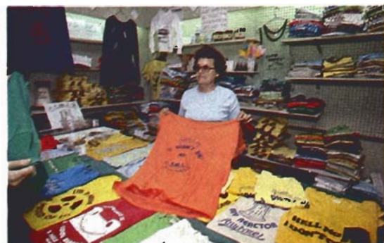
Le marché immobilier, le prix de la terre, le tourisme et l'économie en général sont en chute libre. Seule l'industrie des T-shirts portant des commentaires sur l'accident semble prospérer !